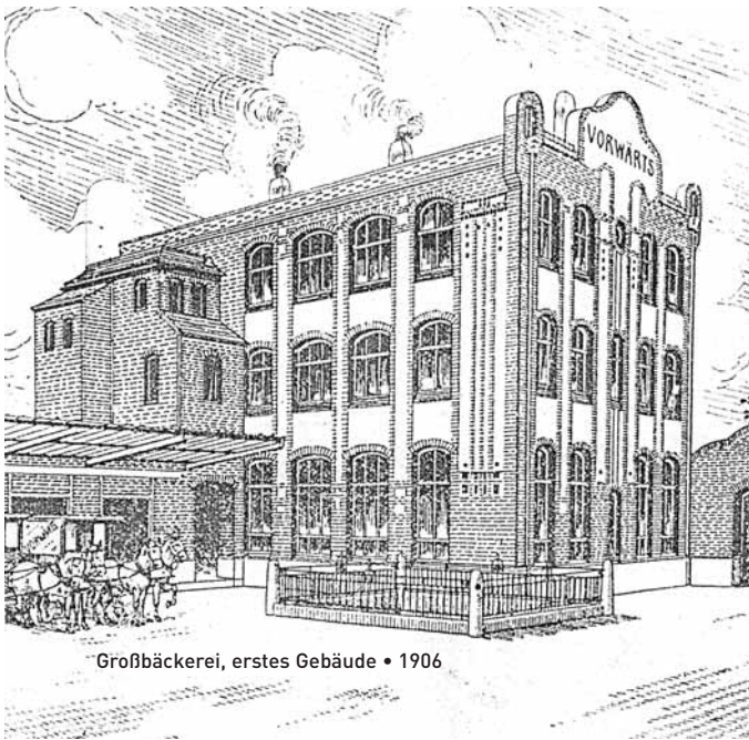
Großbäckerei, erstes Gebäude • 1906